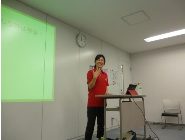
講師の先生が、スライドを使って説明

6/20(火)鹿児島県助産師会から助産師の先生をお招きして「いのちの授業」を実施。この授業では、「いのち」、「思春期の心と身体」、「性感染症」などを中心に「自分」を大切にすることを学びました。参加した生徒は、心身がバランスよく成長するために、睡眠や食事、運動の重要性を理解しました。