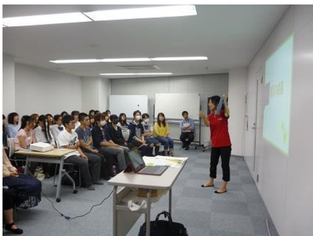
「いのち」に関する絵本の説明も！