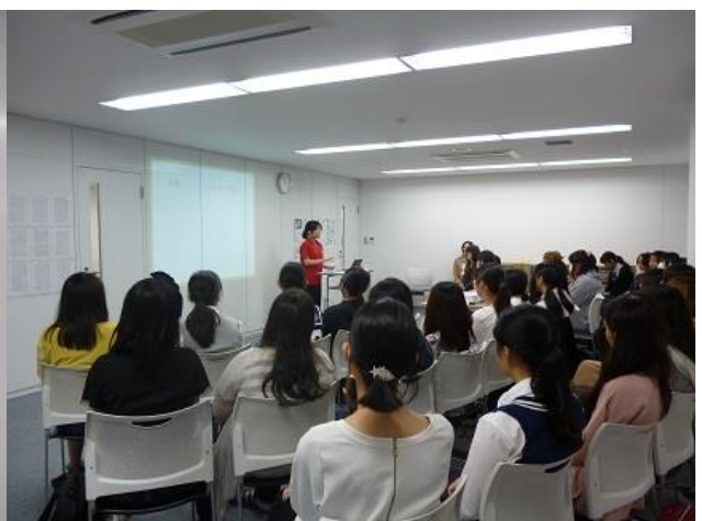
高校生は7時間寝る！ことが重要です。