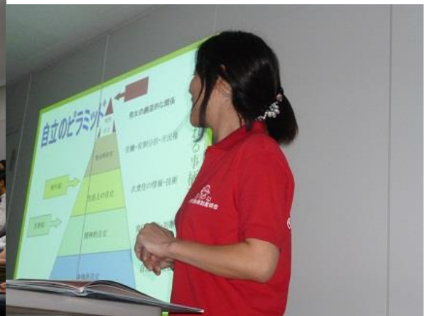
自立にはそれぞれの成長に応じた課題もあります。