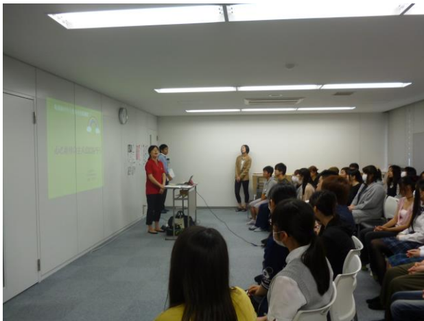
私語もなくしっかりと聞きます。